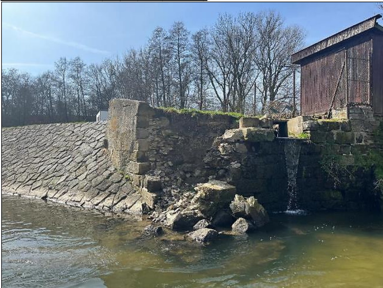
Rozbořená stávající opěrná zeď na levém břehu v podjezí jezové kce v ř. km 8,426 vodního toku Novohradka

Fotodokumentace současného (stávajícího) stavu (březen 2024):