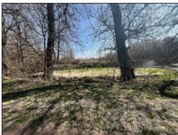
Místo plánovaného sjezdu do koryta vodního toku pohled od příjezdové komunikace

V rámci stavby bude dočasně zbudován sjezd do koryta vodního toku pro potřeby přístupu k předmětné stavbě. Sklon svahu koryta vodního toku se v daném místě v současné době pohybuje kolem hodnoty 1:2. V rámci stavby bude upraven na hodnotu (3,0 – 28,6 %). V rámci realizace je předpokládáno s využitím pro potřeby zbudování sjezdu místního zemního materiálu získaného v rámci prohrábků koryta popsané v předchozím odstavci, v případě nedostatečného množství bude využit naplavený zemní štěrkopísčitý materiál ze štěrkové lavice. Předpokládaná šířka sjezdu je navržena na hodnotu 3,5 m. Při dané šířce je předpokládáno s potřebou zemního materiálu o velikosti množství cca 22,0 m 3 . Zemní materiál bude uložen na vrstvu separační geotextilie, u jezdové plochy je pak předpokládáno s jejím zpevněním v rozsahu sjezdu např. betonovými panely, PZD deskami či jezdovými roznášecími deskami (plastové/kovové) v závislosti na možnostech zhotovitele. Po dokončení prací bude sjezd zrušen a zemní materiál zpětně rozplaven v rámci širší části průtočného profilu koryta vodního toku či zpětně uložen do původního místa odtěžby v rámci štěrkové lavice. Po dokončení realizace bude provedena obnova dotčených ploch, tedy bude provedeno jejich uvedení do stavu odpovídajícího před zahájením stavebních prací – v rámci svahu bude provedeno urovňování terénu se zajištěním osetí travním semenem (travní směs svahová) 0,025 kg/m 2 a ohumusováním.