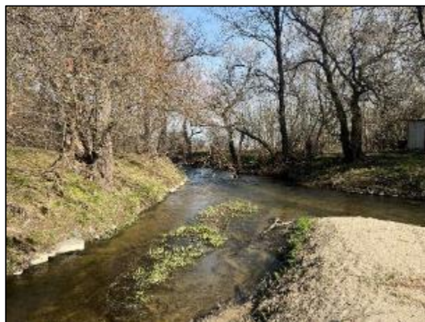
Prohrábka koryta vodního toku při patě levého břehu koryta vodního toku

V rámci stavby bude dočasně zbudován sjezd do koryta vodního toku pro potřeby přístupu k předmětné stavbě. Sklon svahu koryta vodního toku se v daném místě v současné době pohybuje kolem hodnoty 1:2. V rámci stavby bude upraven na hodnotu (3,0 – 28,6 %). V rámci realizace je předpokládáno s využitím pro potřeby zbudování sjezdu místního zemního materiálu získaného v rámci prohrábků koryta popsané v předchozím odstavci, v případě nedostatečného množství bude využit naplavený zemní štěrkopísčitý materiál ze štěrkové lavice. Předpokládaná šířka sjezdu je navržena na hodnotu 3,5 m. Při dané šířce je předpokládáno s potřebou zemního materiálu o velikosti množství cca 22,0 m 3 . Zemní materiál bude uložen na vrstvu separační geotextilie, u jezdové plochy je pak předpokládáno s jejím zpevněním v rozsahu sjezdu např. betonovými panely, PZD deskami či jezdovými roznášecími deskami (plastové/kovové) v závislosti na možnostech zhotovitele. Po dokončení prací bude sjezd zrušen a zemní materiál zpětně rozplaven v rámci širší části průtočného profilu koryta vodního toku či zpětně uložen do původního místa odtěžby v rámci štěrkové lavice. Po dokončení realizace bude provedena obnova dotčených ploch, tedy bude provedeno jejich uvedení do stavu odpovídajícího před zahájením stavebních prací – v rámci svahu bude provedeno urovňování terénu se zajištěním osetí travním semenem (travní směs svahová) 0,025 kg/m 2 a ohumusováním.